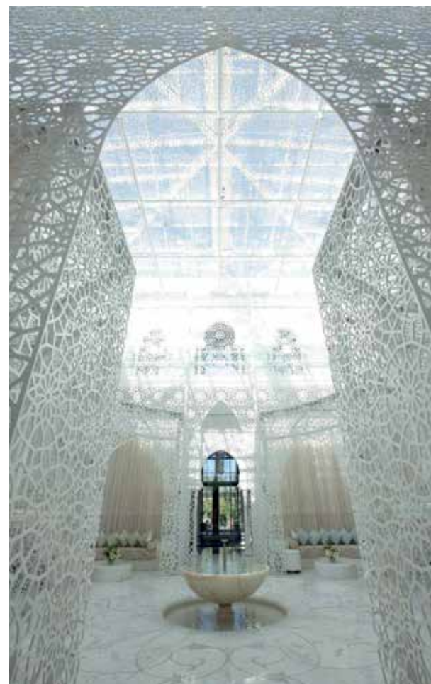
Uno degli ambienti del Mamounia di Marrakech.

Via Venezia, 2 - 54033 Carrara MC Showroom via Chiasso Barletti, 23 - 55100 Lucca info@progetto99.com | www.progetto99.com