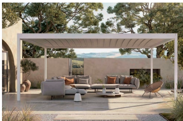
Médaille d'or dans la catégorie Outdoor du Innovation Award 2024 de R+T, Alba Butterfly de Corradi est un concept de pergola avec toile repliable en accordéon à empaquetage.

C'est une nouvelle toiture à empaquetage avec système de pantographe que propose l'inventeur italien de la Pergotenda. Alba Butterfly se caractérise par des piliers élancés de 11 x 11 cm et une poutre avec large gouttière - 12,2 x 8,7 cm - pour une évacuation des eaux pluviales quasi six fois supérieure aux limites imposées par les réglementations de l'UE. Avec un seul module à quatre piliers - jusqu'à 550 x 715 cm -, cet espace peut être complété par toutes les fermetures de la gamme Corradi et s'équiper d'un éclairage à Led sur tout le périmètre interne.